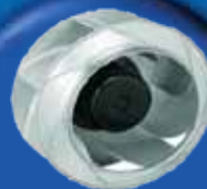
LÜFTER MIT HOCHKAPAZITÄT